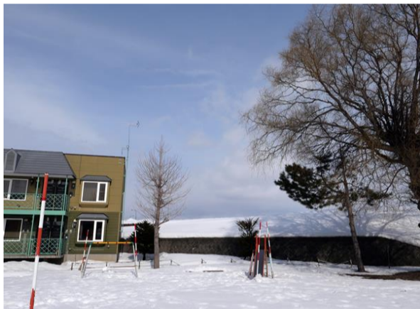
旭西第1公園の遊具が5月以降に更新の予定

② 新町っ子もちつき大会は、規模を縮小し会館を会場にして行う。町内の子どもだけを対象にし「新西子どももちつき大会」の名称に変更する。 ③ 資源回収活動については、