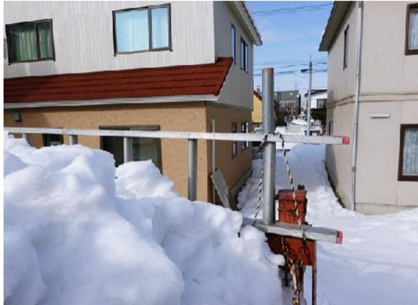
新西会館の屋根からの落雪(3月13日)

意と警戒をしながら、どうしても実施できるのか? 実施するにはどこを変えようとよいかの視点で望まざるを得ない。